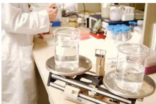
Standarder kan bidra til å lette implementeringen av forskningsresultater.

Selv om standarder spiller en viktig rolle på innovasjonsområdet, er det absolutt et potensial for å øke standardiseringens bidrag, blant annet ved å ta tak i følgende utfordringer: