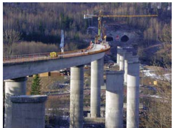
Standarder er helt avgjørende for et fungerende næringsliv.