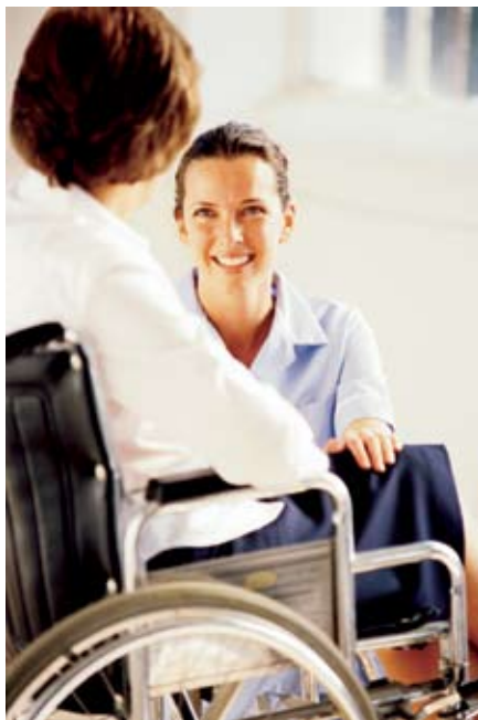
Standardisering skjer på stadig nye områder.