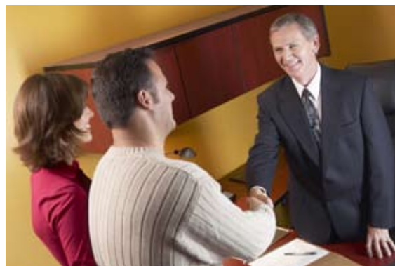
Kontrakter og andre typer tjenester er et område i vekst når det gjelder standardisering.

Den generelle utfordringen i forhold til nye områder er å skape forståelse hos nye brukergrupper for hvordan standarder kan styrke konkurransekraften og bidra med kunnskap til markedet og de ulike aktørene. I tillegg er