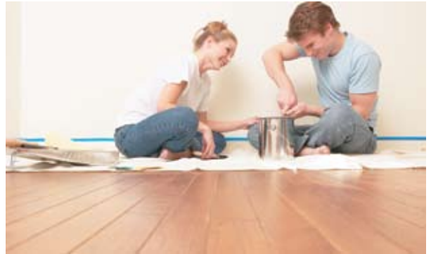
Standarder skal gjøre hverdagen enklere for forbrukere.

Følgende utfordringer ved standardisering er særlig aktuelle for forbrukerne: