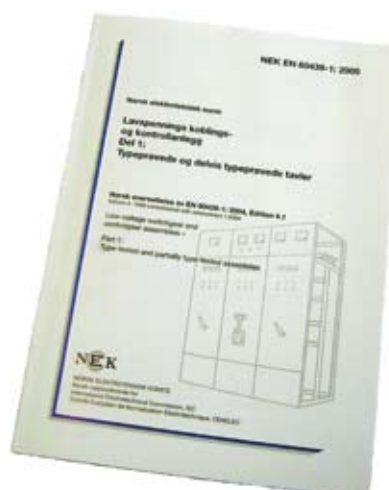
Norsk elektroteknisk norm