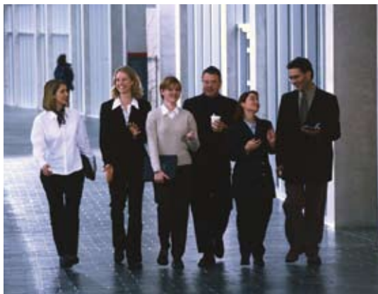
Deltakernes kompetanse er standardiseringens viktigste ressurs.

Deltakerne i standardiseringsarbeidet nasjonalt og internasjonalt finansierer sin egen innsats, og bidrar på denne måten med ressurser som i verdi langt overstiger inntektene som går med til drift av standardiseringsorganisasjonene. Næringslivet er den største bidragsyter i så måte.