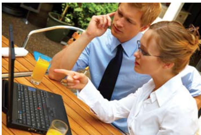
Uformelle standardiseringsmiljøer finnes ofte innenfor IKT-området.

I gruppen av uformelle aktører er det store forskjeller mellom de ulike aktørene. De kan deles inn i tre grupper: