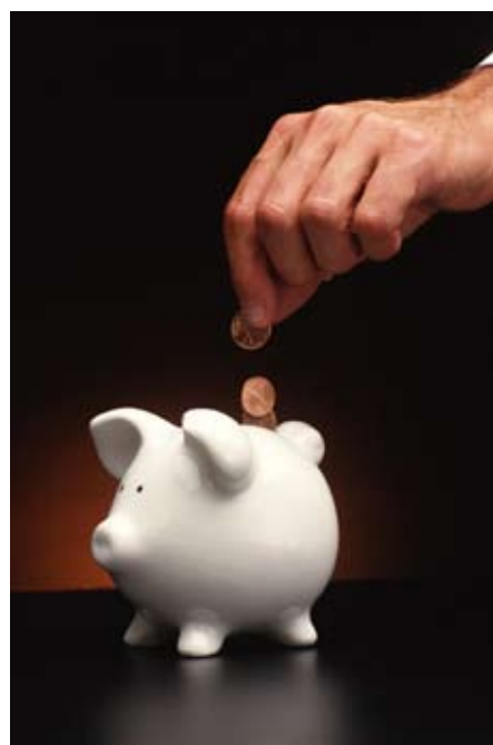
Bruk av standarder gir store besparelser for samfunnet.

Det er gjort flere undersøkelser som på enkelte områder gir tallstørrelser for å beskrive kostnadsbesparelsene ved standardisering. Det hittil mest grundige arbeidet er en tysk undersøkelse som har kommet til at standardiseringen innebærer en kostnadsbesparelse for samfunnet som tilsvarer 1 % av bruttonasjonalproduktet. I en direkte sammenligning for Norge vil dette medføre at standardiseringen årlig sparer det norske samfunnet for omkring 20 milliarder kroner. Imidlertid er næringsstrukturen annerledes i Tyskland enn i Norge, samtidig som standardbruken kan være mindre omfattende i Norge. Anslaget for besparelser i Norge kan derfor være lavere enn for Tyskland.