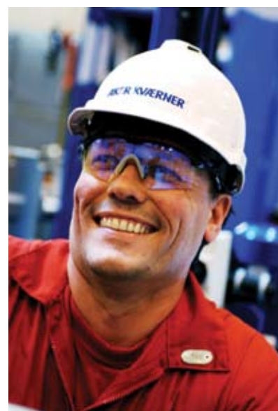
Standarder ivaretar krav til helse, miljø og sikkerhet, og bidrar til økt verdiskaping.