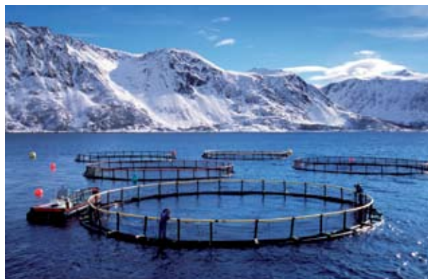
Ressursene til standardisering må anvendes på områder som Norge prioriterer.