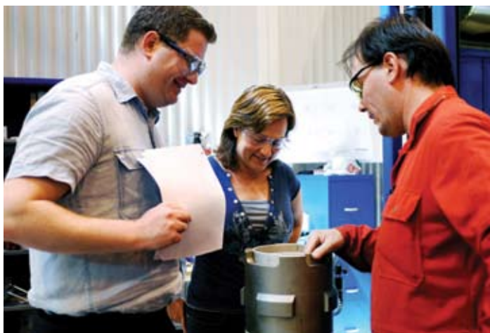
Det er viktig med flere deltakere fra små og mellomstore bedrifter i standardiseringsarbeidet.

I Norge er det svært få private og offentlige virksomheter som har satt utvikling og bruk av standarder inn i et politisk eller strategisk perspektiv. En vesentlig årsak til dette er mangel på medarbeidere som har spisskompetanse på utvikling og bruk av standarder nasjonalt og internasjonalt. I tillegg er det for mange brukergrupper som oppfatter standarder som vanskelig tilgjengelig.