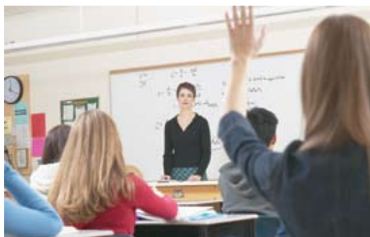
Standarder og standardisering bør inngå som en naturlig del av opplæringen.

Hovedmål 3: Nasjonale interesser og innflytelse i internasjonal sammenheng sikres gjennom aktiv deltakelse i internasjonalt standardiseringsarbeid på prioriterte områder.