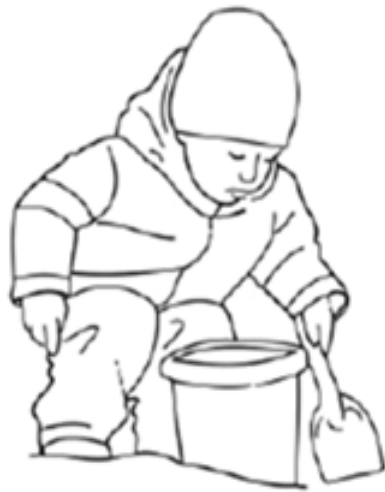
Barn i barnehage

Nasjonal strategi for opplæring av befolkningen i førstehjelp