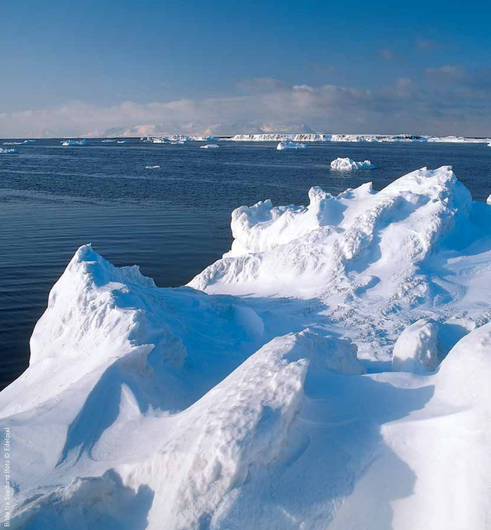
Bilde fra Svalbard