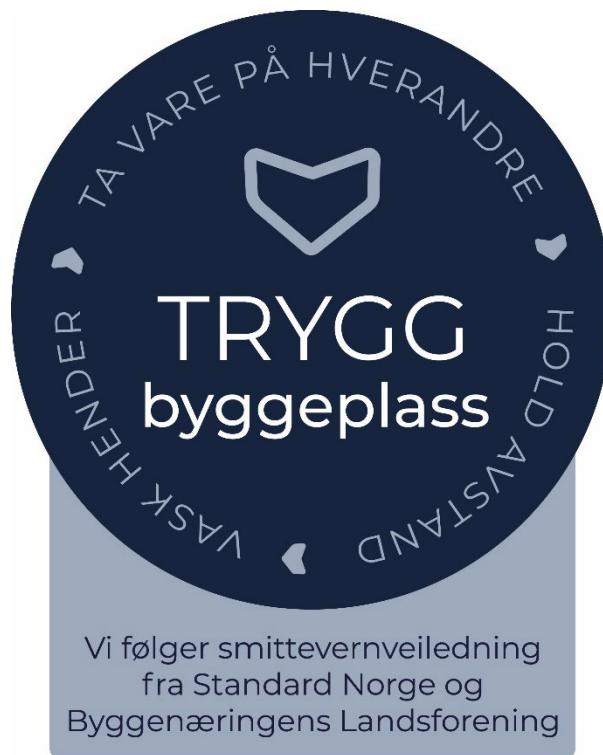
Ilustracja 2 – Bezpieczny plac budowy

Firmy, które zobowiązują się przestrzegać zasad i wdrożyć środki opisane w tym dokumencie, mogą używać emblematu pokazanego na ilustracja 2.