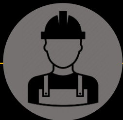
Bygg & anlegg