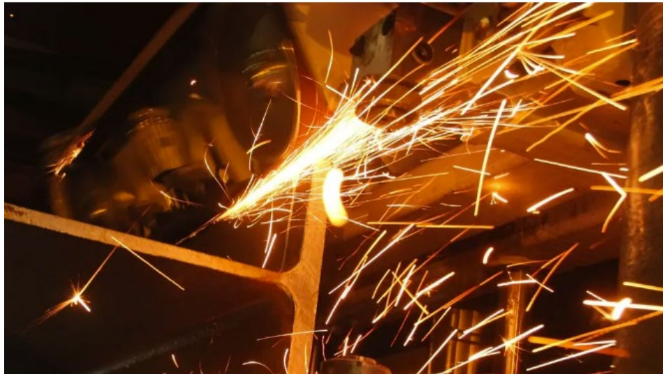
Til tross for skyhøye strømpriser virker det som om norske bedrifter knapt bryr seg om å spare strøm – de siste tallene fra ISO viser at det ikke var mer enn 42 sertifiseringer for stormsparestandarden ISO 50001.

Energisparingen er på virkelig sparebluss i norsk næringsliv. Ikke mer enn 0,7 promille av norske virksomheter har sertifiserte systemer for energisparing.