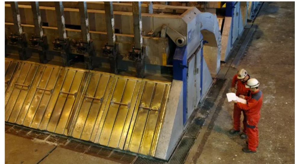
Hydro satser stort på energieffektivisering og sparer både energi og kostnader som følge av satsingen. Den internasjonale standarden for energiledelse er nøkkelen i arbeidet.

Norsk industri sløser 30 prosent av sitt energiforbruk.