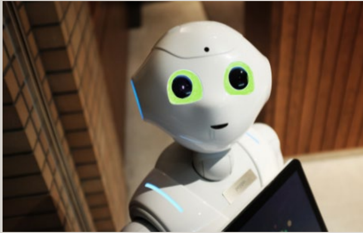
Apper Chatbots Ferdige moduler